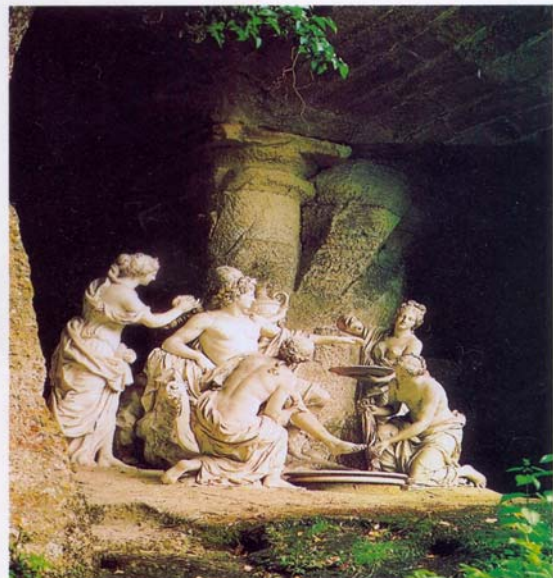
Fig. 4 – Girardon, Apolo com as Ninfas (Gruta de Tétis, Versalhes)