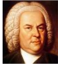
Johann S. Bach (1685-1750)

- PINTURA: Na pintura, é clara a influência do conflito entre razão e fé. As obras de arte demonstram essa dualidade através do uso de contrastes, como claro e escuro, luz e sombra, além da exploração das ideias de profundidade e de intensidade dramática. Assim sendo, são notáveis as tonalidades quentes e o aparato teatral de expressões e atitudes. Rubens é considerado o expoente máximo da pintura, embora se destaquem outros pintores como Rembrandt, Vélasquez, Van Dyck , etc.