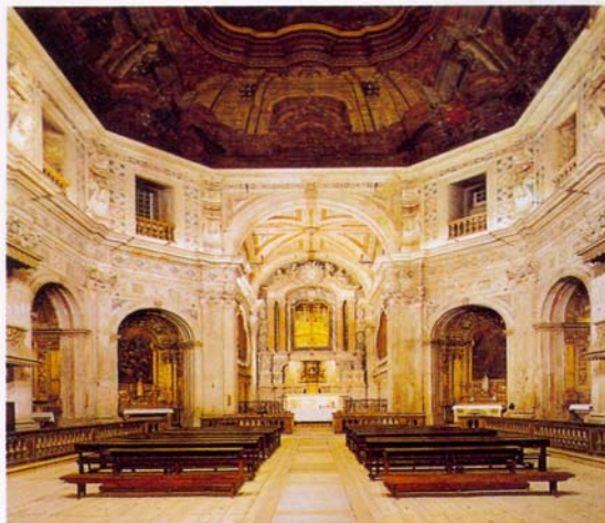
Fig. 3 – João Antunes, Igreja do Menino de Deus (Lisboa)