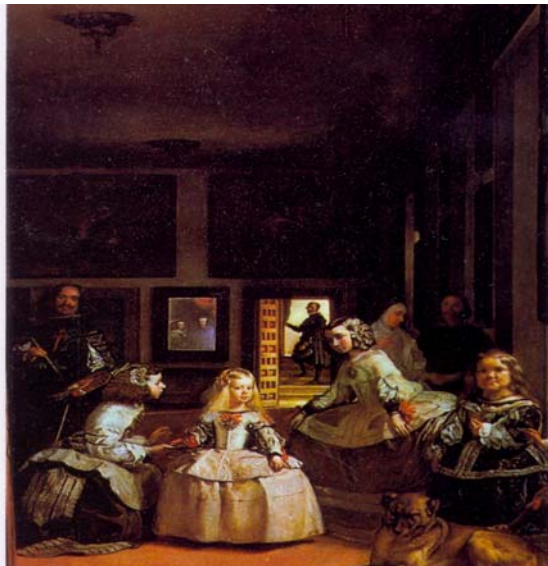
Fig. 1 – Velásquez, As Meninas

Os artistas barrocos foram patrocinados pelos monarcas, burgueses e pelo clero e as obras de pintura e escultura deste período são rebuscadas, detalhistas e expressam as emoções da vida e do ser humano.